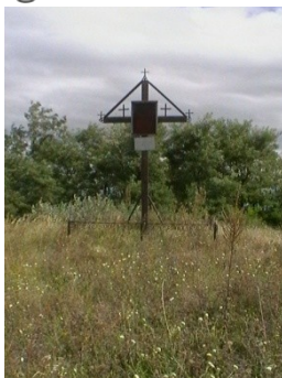
Fig. 2 – Culmea ”Cetatea “