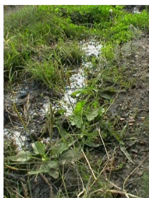
Fig. 4 La izvoarele Zaharioaiei