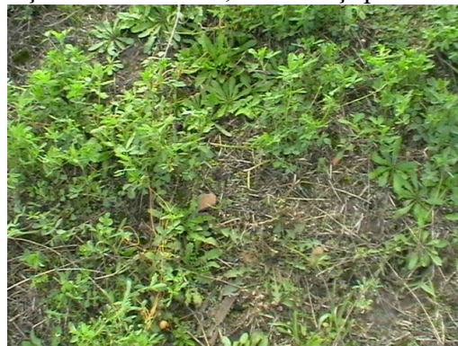
Fig. 6 „Comoara ” de la „Ocol”

Cercetările arheologice atestă existența unor urme de locuire omenească foarte vechi pe toată suprafața comunei. Astfel :