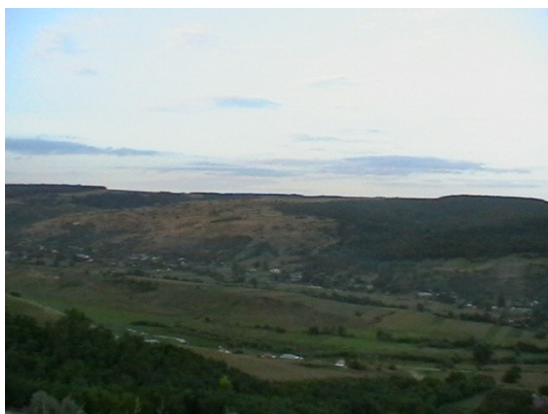
Fig. 8. Partea “lineară” a Ghergheștiului

Satele fiind vechi, își păstrează forma adunată și aspectul meandric al ulițelor. Contruirea în anul 1968 a DJ 245 a adus schimbări în organizarea satelor comunei. Astfel, din ce în ce mai mulți gospodari și-au construit casele „la șosea” pentru a avea acces la rețeaua județeană de drumuri. Din acest motiv, părți din sate au căpătat formă lineară (partea apuseană a satului Lunca, răsăriteană a satelor Gherghești și Corodești, partea sudică a satului Chetrosu).