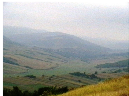
Fig. 1 – Dealurile care străjuiesc